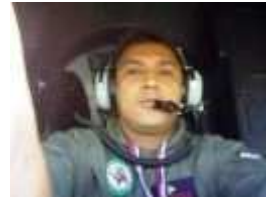
(EXTRACTOS DE LA CARTA)